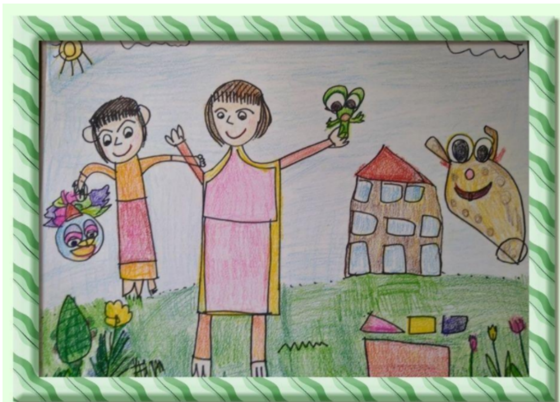
姉妹でパペットあそび Mさん作